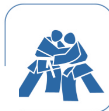
Judo Goshin Jitsu