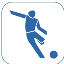
Fußball für alle Altersgruppen