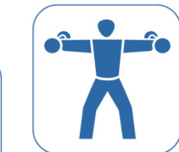
Turnen / Fitness für Kinder und Senioren Zumba für Kinder und Senioren