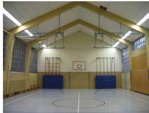
TH Regenbogenschule Dieringhausen